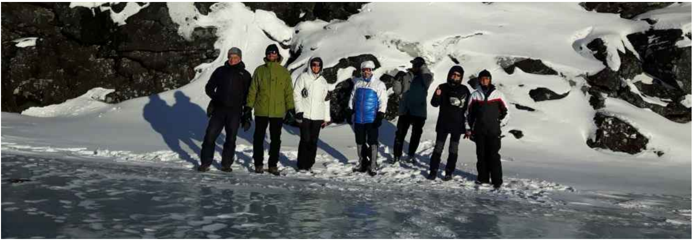
Supergiornata, Supersole, Superpanorama. Temperatura fresca (-18°) ma assolutamente gradevole.